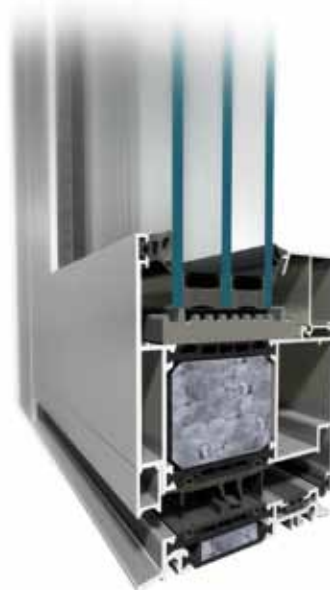
MB-104 Passive SI