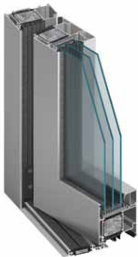
MB-104 Passive SI