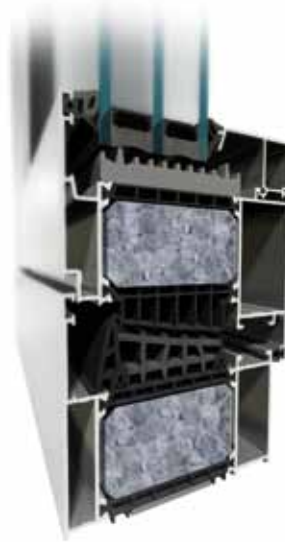
MB-104 Passive SI